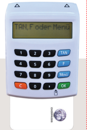
Bedienungsanleitung und Funktionsweise